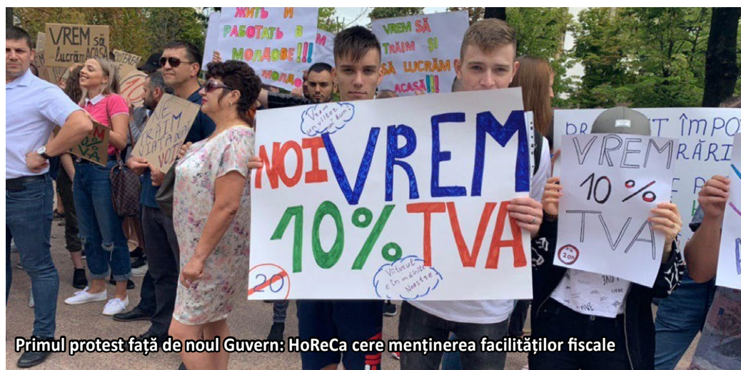
Primul protest față de noul Guvern: HoReCa cere menținerea facilităților fiscale