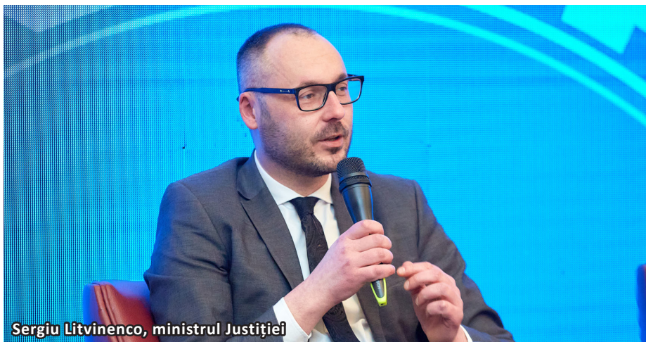
Sergiu Litvinenco, ministrul Justiției

Una dintre cele mai importante provocări și totodată cea mai spinoasă problemă rămâne reformarea justiției din Republica Moldova. Timp de trei decenii aceasta a fost grevată de interese creptocratice și viciată de o corupție endemică.