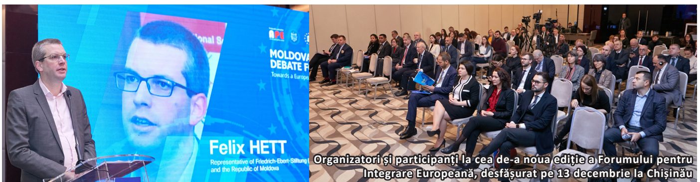
Organizatori și participanți la cea de-a noua ediție a Forumului pentru Integrare Europeană, desfășurat pe 13 decembrie la Chișinău

„Integrarea europeană nu este o alegere geopolitică, ci un model de dezvoltare. Este despre cum văd moldovenii viitorul lor, despre ce fel de țară și ce fel de stat își doresc să construiască. Integrarea europeană nu este doar viitorul, dar într-o anumită măsură și prezentul Republicii Moldova”, a declarat Felix Hett, reprezentantul FES în Ucraina și Republica