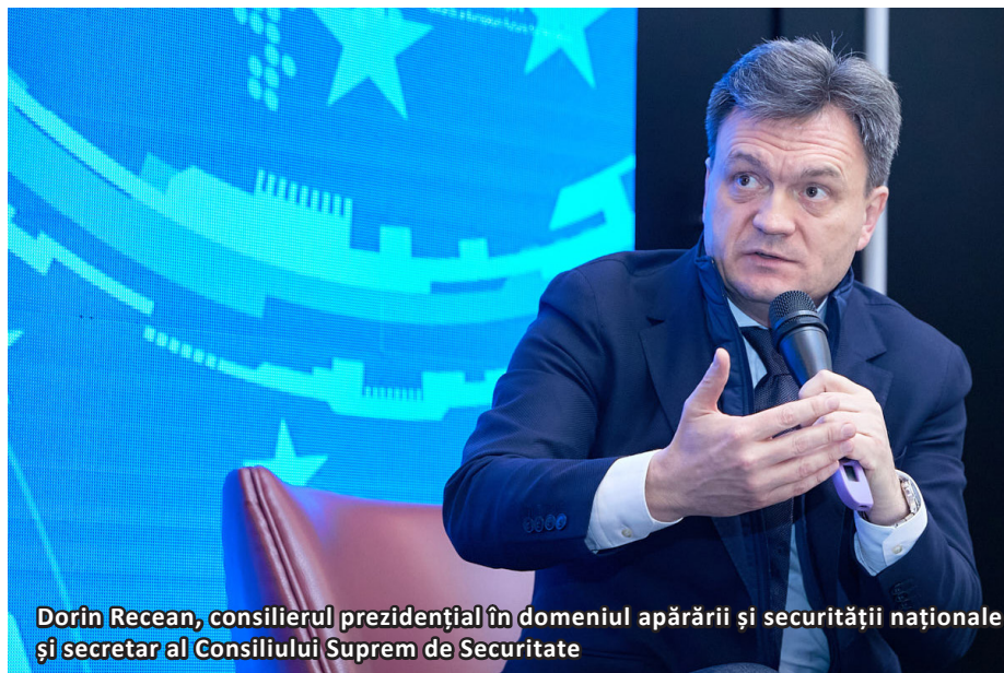
Dorin Recean, consilierul prezidențial în domeniul apărării și securității naționale și secretar al Consiliului Suprem de Securitate

Oficialul a adăugat că la fel s-a acționat și în cazul conflictului transnistrean. „De ce în 30 de ani de când există regiunea separatistă energia electrică pentru Republica Moldova, țară cu aspirații europene, a venit din această regiune separatistă? Și acum am ajuns să depindem tot de energia de acolo,