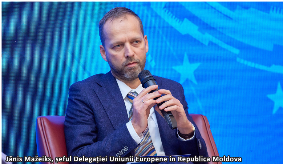
Jānis Mažeiks, șeful Delegației Uniunii Europene în Republica Moldova

a angajamentelor, cât de calitatea procesului. Mai bine să se facă lucrurile calitativ decât să se alerge pentru dead line-uri. Este nevoie să găsim un echilibru între viteză și calitate”, a declarat Jānis Mažeiks.