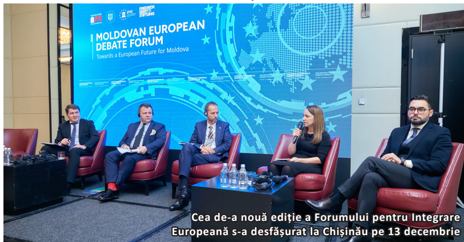
Cea de-a nouă ediție a Forumului pentru Integrare Europeană s-a desfășurat la Chișinău pe 13 decembrie

Cea de-a nouă ediție a Forumului de Integrare Europeană a Republicii Moldova, organizat de Fundația „Friedrich Ebert”, în parteneriat cu Institutul pentru Politici și Reforme Europene (IPRE), Asociația pentru Politică Externă (APE), în parteneriat cu Ministerul Afacerilor Externe și Integrării Europene (MAEIE), a prilejuit discuții