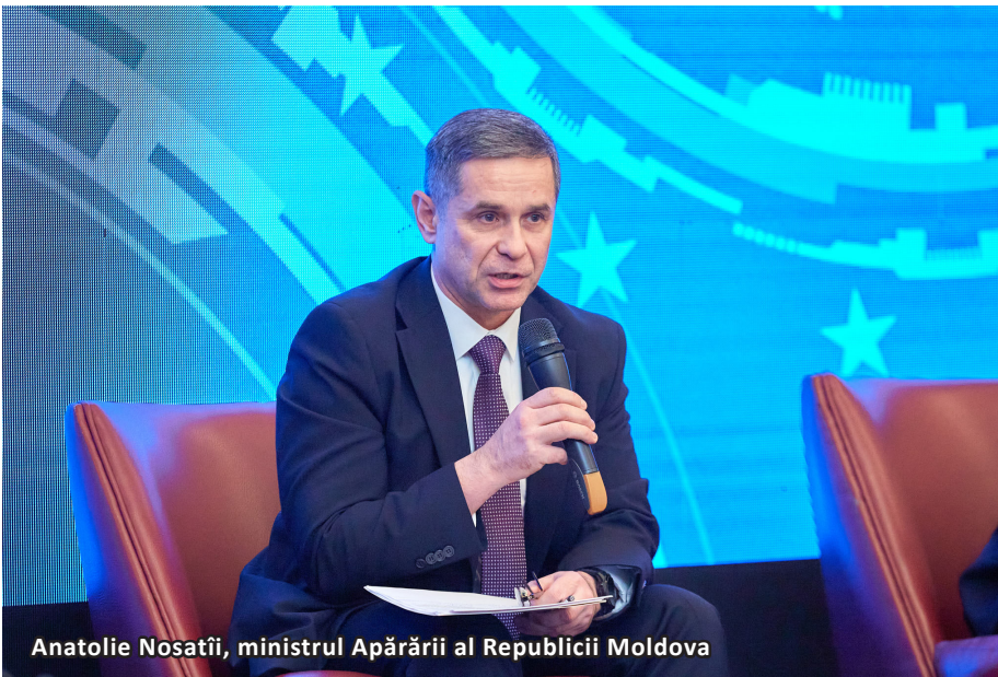
Anatolie Nosatîi, ministrul Apărării al Republicii Moldova

În cadrul celui de-al treilea panel al Forumului Integrării Europe a Republicii Moldova, invitații au discutat despre problemele de securitate și apărare ale țării create de invazia rusă din proximitate, în Ucraina. Cu o armată subfinanțată și nemodernizată de peste 30 de ani de zile, Republica Moldova are puține opțiuni militare de a se apăra singură. Mai mult, propagandă pro-rusă a lucrat intens pentru a distorsiona sensul neutralității militare care împiedică astăzi Republica Moldova să ia o opțiune spre cea mai puternică alianță militară a momentului – NATO.