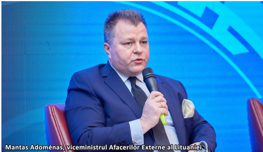
Mantas Adomėnas, viceministrul Afacerilor Externe al Lituaniei

aproximativ 60-65 la sută dintre angajamentele asumate față de UE atunci când a primit statutul de țară candidată.